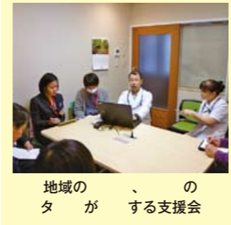
地域のタがする支援会

BFユニットでは、医療観察法に基づき厳格な手続きをとりながら手厚い医療を提供しています。患者さまごとに多職種スタッフがチームを組み、個別での関わりを中心にしながら、回復と社会復帰に向けた各種の治療プログラムを行います。退院後も、継続的な通院治療や地域の医療福祉サービスを受けられるよう、保護観察所等の関係機関と密接に連携をとって支援しています。