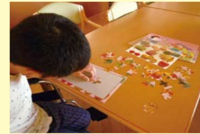
集団作業療法(作活)