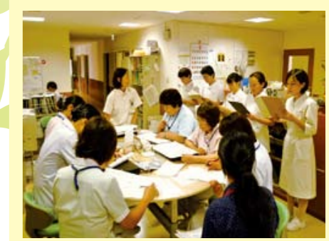
病棟 - ング な支援を るた 回 - ングを います。ご家族の かせません。