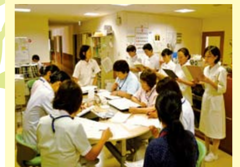
病棟 - ング な支援をるた 回 - ングをいます。ご家族のかせません。