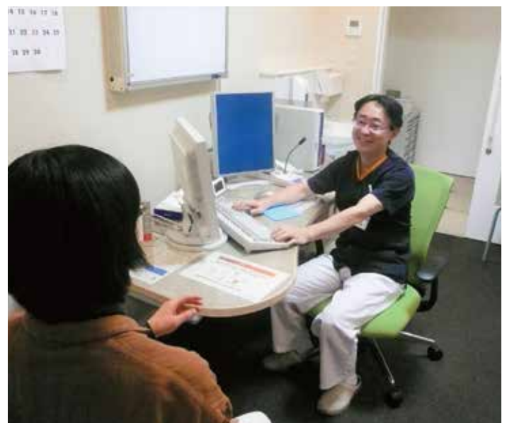
薬剤師外来の様子

そこで、病院薬剤師が薬に対する悩みを聞き、不満に対する処方提案等を行う目的で、「薬剤師外来」を平成29年3月より開始しました。「もっと早くに話を聞きたかった」、「服薬の大切さがわかった」などのご意見をいただいております。患者さんの薬に対する理解や満足度が上がっていると感じています。